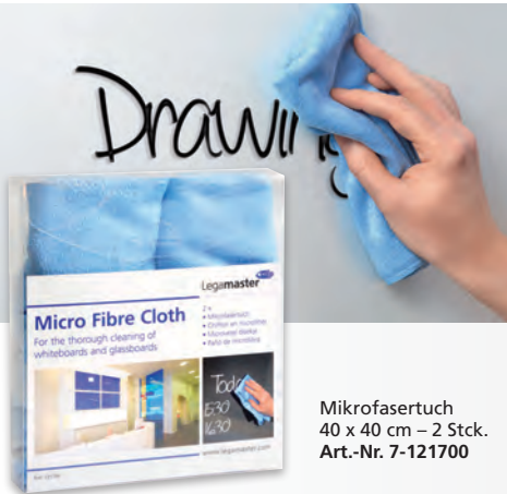
Mikrofaser Tuch 40 x 40 cm – 2 Stck. Art.-Nr. 7-121700