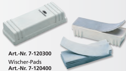
Art.-Nr. 7-120300 Wischer-Pads Art.-Nr. 7-120400