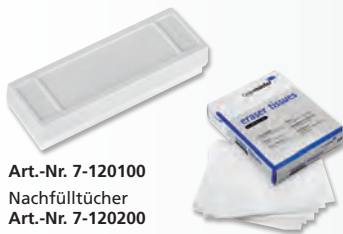
Art.-Nr. 7-120100 Nachfülltücher Art.-Nr. 7-120200