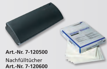
Art.-Nr. 7-120500 Nachfülltücher Art.-Nr. 7-120600